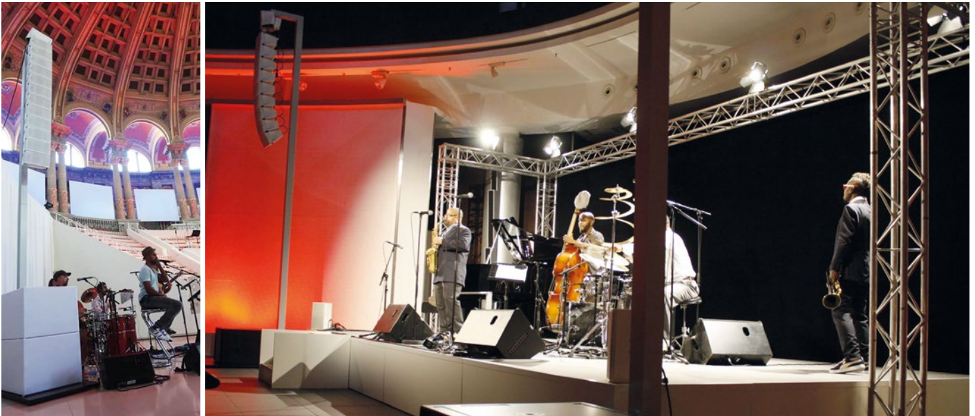
⊥ P6 ⚡ 450cm ⊥ 12x NEXO GEO M6